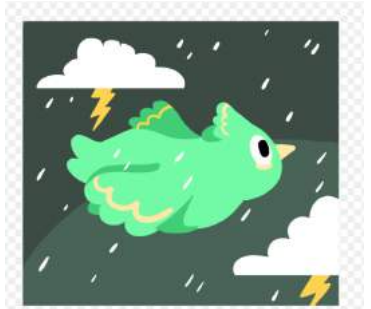
Ik zet door bij tegenslagen.

In vorige nieuwsbrieven heeft u kunnen lezen dat wij bezig zijn met de onderwijsvernieuwing "Leren zichtbaar maken". In deze nieuwsbrief staat het volgende kenmerk van een zichtbaar lerende leerling centraal: